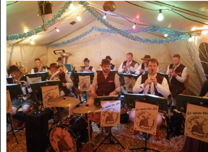
Kapelle „Josef Ambach“ 2023

In der wunderbar dekorierten SGV-Hütte steht einem gelungenen Gaudi Abend mit einem zünftigem Essen und gezapftem Bier nichts im Wege. Die Trachtenkapelle Josef Ambach sorgt wieder für Stimmung im beheizten Zelt. Beim Bierkrug-Stemmen können die Kräfte gemessen werden und als Belohnung gibt es wieder Preise zu gewinnen. Lederhose und Dirndl gerne gesehen.